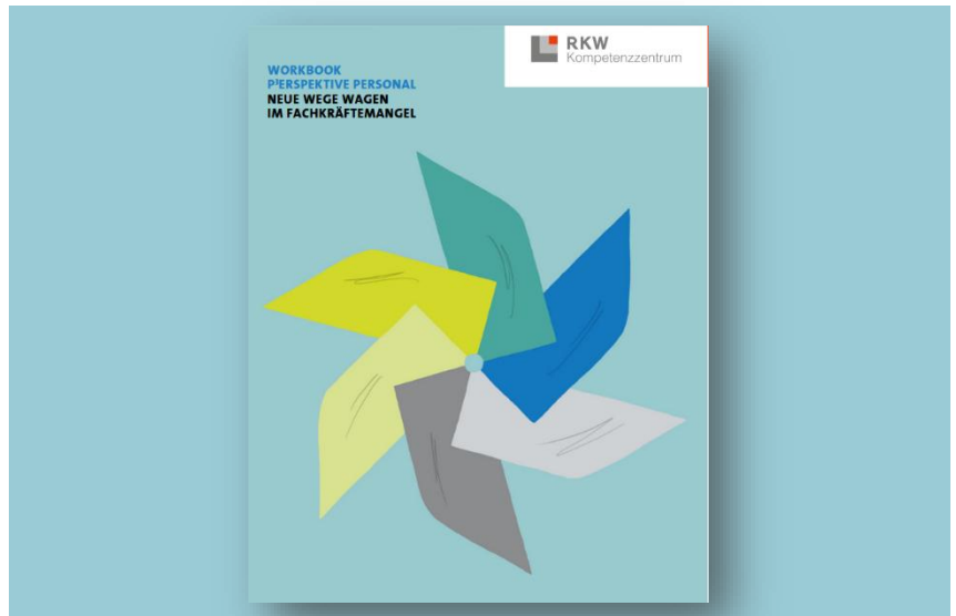
Titelseite des RKW-Workbooks „P 3 erspektive Personal“

Mit dem Workbook „P 3 erspektive Personal“ lernen Führungskräfte von kleinen und mittleren Unternehmen (KMU) neue Strategien zur Fachkräftesicherung kennen. Es erleichtert, zentrale Handlungsfelder im Personalmanagement zu erkennen, Maßnahmen systematisch abzuleiten und die Personalarbeit nachhaltig auf die Zukunft auszurichten.