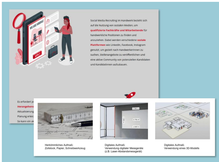
Ausschnitt aus den E-Learning Kursen