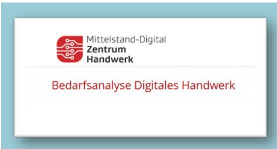
Startseite des Digitalisierungs-Checks

1. Grunddaten. Erfasst grundlegende Informationen zum Betrieb wie Name, Größe, Branche.