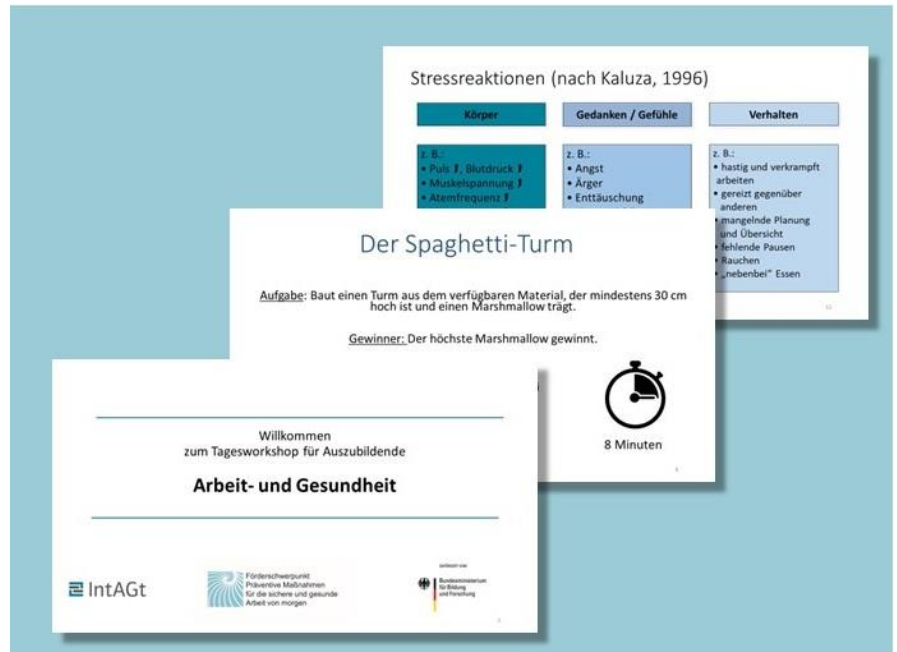
IntAGt-Musterfoliensatz - Beispielseiten