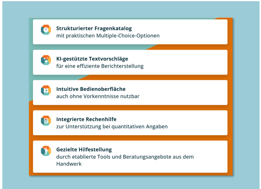
Ausschnitt von der Webseite des Zukunfts-Kompass Handwerk