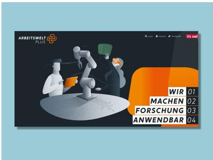
Website des Kompetenzzentrums mit allen Angeboten

Das Kompetenzzentrum Arbeitswelt.Plus bietet Führungskräften in Ostwestfalen-Lippe praxisnahe Unterstützung aus der Forschung zum Thema Künstliche Intelligenz und ihre Auswirkungen z. B. Informationen, Weiterbildungs- und E-Learning-Angebote, Beratung oder Softwaretools.