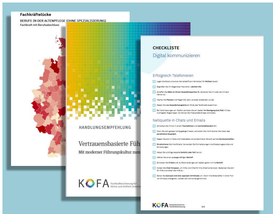
Einblicke in die Produkte des Kompetenzzentrum Fachkräftesicherung (KOFA)

Führungskräfte können das Kompetenzzentrum als erste Anlaufstelle für alle Themen der Fachkräftesicherung und Personalarbeit nutzen. Dabei können die Angebote sowohl zum niederschweligen Einstieg in die Thematik wie auch als fundierte Informationsquelle oder als Unterstützung bei konkreten Herausforderungen dienen. Insbesondere in den Handlungsempfehlungen finden Führungskräfte direkt umsetzbare Schritt-für-Schritt-Anleitungen für eine Vielzahl von Themen.