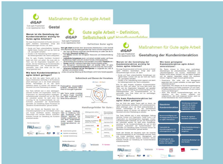
Abbildung: Kurze (eine Seite) Informationen zu Maßnahmen zum Selbstcheck „Gute agile Projektarbeit“

Einzelne oder auch alle Führungskräfte im Betrieb können den Selbstcheck durchführen, um einen