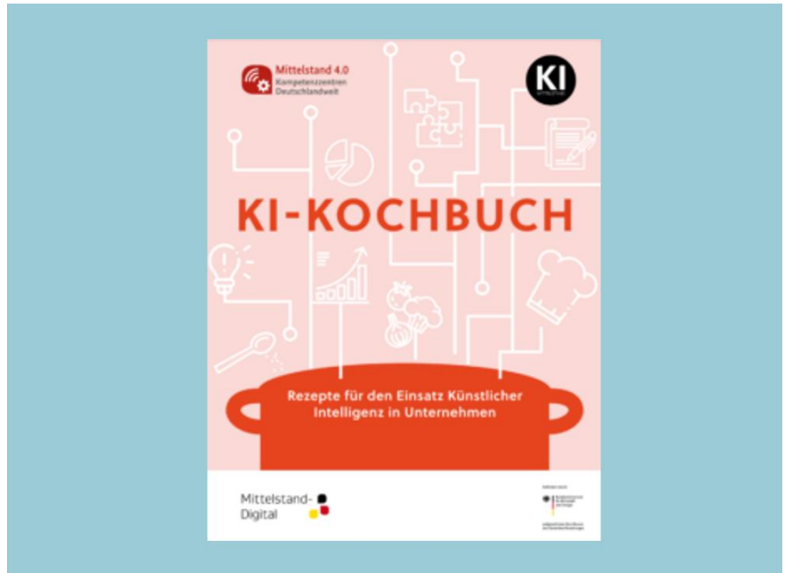
Abbildung: Praxisbroschüre „KI-Kochbuch - Rezepte für den Einsatz Künstlicher Intelligenz in Unternehmen“

Wie bei einem Kochrezept geht es um den Grundsatz, dass Betriebe zunächst auf den „Geschmack“ einer möglichen KI-Nutzung kommen müssen. Das ist die Voraussetzung, um sich dem Thema grundsätzlich nähern zu können (bzw. zu wollen). Darüber hinaus wird verdeutlicht, dass jeder Betrieb (durch Mischung „richtiger“ Zutaten) seine jeweils eigenen Lösungen finden muss, um eine produktive Nutzung von KI langfristig zu ermöglichen.