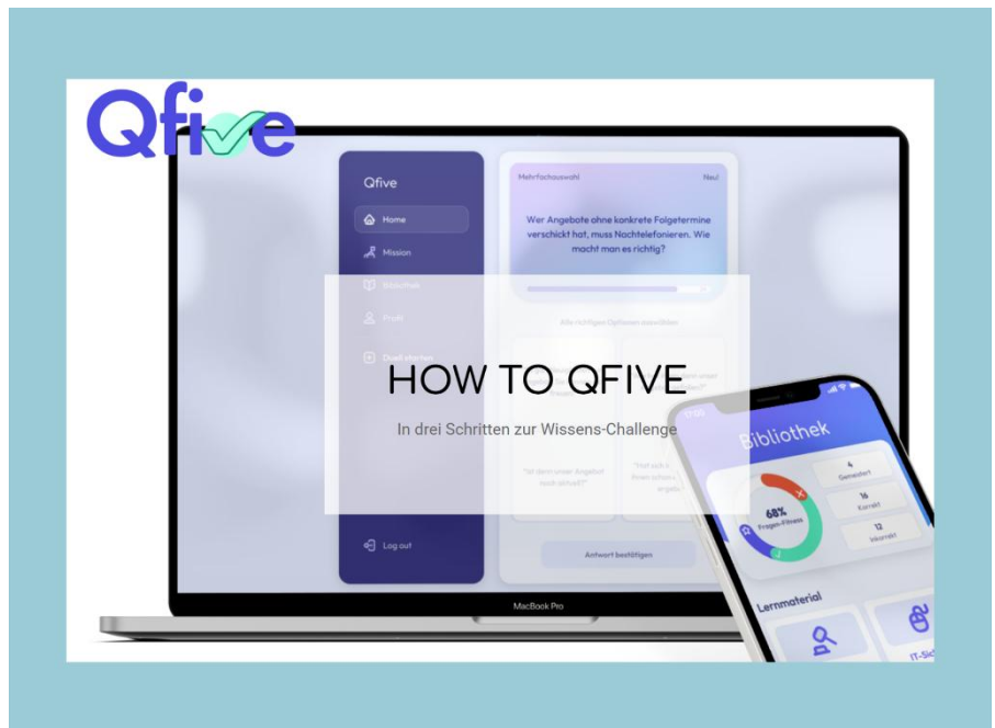
Abbildung: Das KomKI-Quiz in QFive