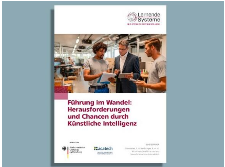
Abbildung: Titelblatt des Whitepaper „Führung im Wandel: Herausforderungen und Chancen durch Künstliche Intelligenz“

KI und Führung lassen sich gut ergänzen und können für eine moderne, menschenzentrierte Führung einen wichtigen Beitrag leisten. Voraussetzung ist eine angemessene Gestaltung der KI-Systeme. Welche Maßnahmen dabei