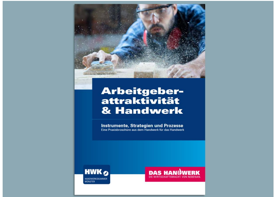
Abbildung: Praxisbroschüre „Arbeitgeberattraktivität und Handwerk“