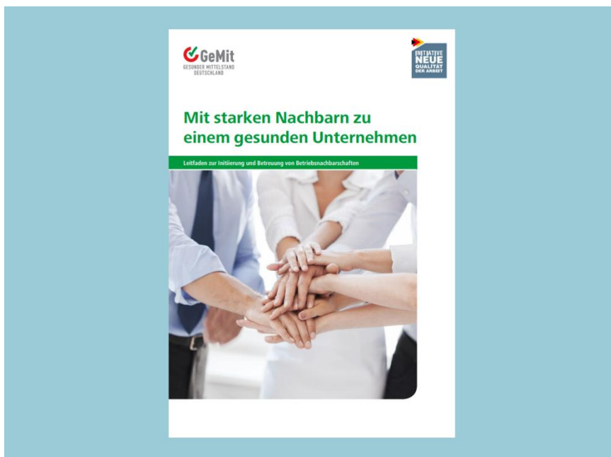
Abbildung: Leitfaden Betriebsnachbarschaften