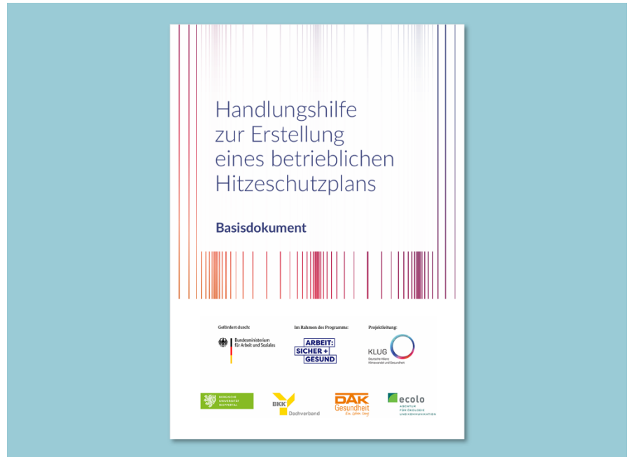
Titelseite der „Handlungshilfe zur Erstellung eines betrieblichen Hitzeschutzplans“

Ein Hitzeschutzplan kann hierbei im Betrieb eine wirksame organisatorische Unterstützung sein. Die Handlungshilfe besteht aus einem Basisdokument in dem die sechs Schritte kurz erklärt werden. Für jeden Schritt stehen darüber hinaus ausführliche Erklärdokumente inkl. Schreibvorlagen und Checklisten zum Herunterladen zur Verfügung.