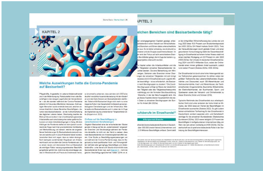
Ausschnitt aus dem Leitfaden „Starke Basis - Starke Arbeit“

Betriebsräte können den Leitfaden kostenlos nutzen, um Basisarbeit im eigenen Betrieb zum Thema zu machen, Schwachstellen zu erkennen und Verbesserungen anzustoßen. Gemeinsam mit Führungskräften kann er als Grundlage für einen strukturierten Austausch dienen, um Maßnahmen zur Verbesserung der Arbeitsbedingungen zu entwickeln und umzusetzen. Der Leitfaden ist übersichtlich aufgebaut, verbindet