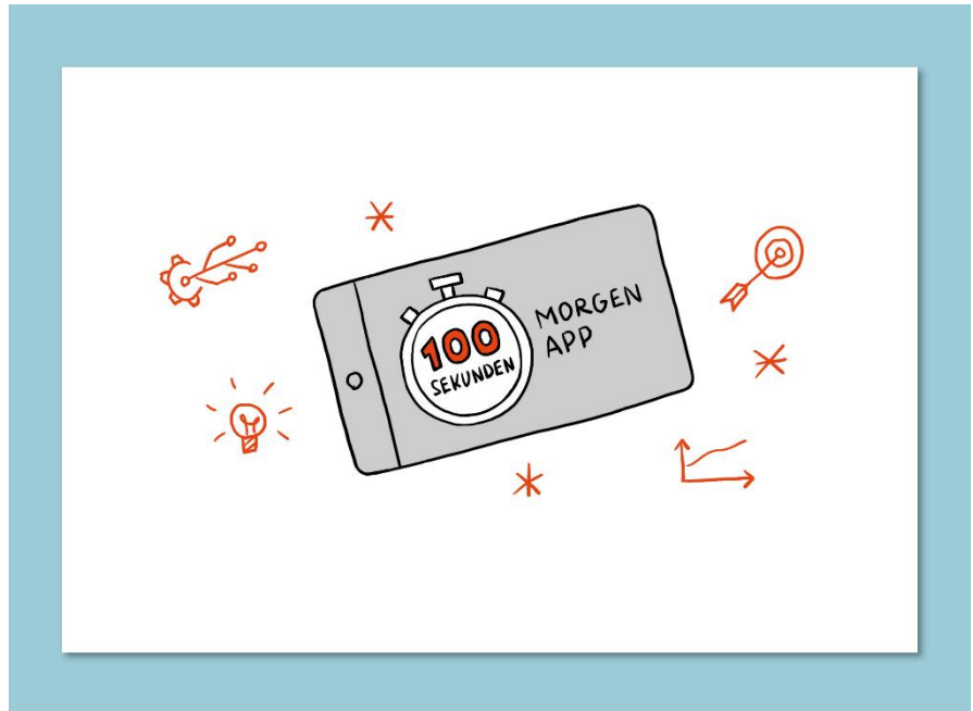
100 Sekunden Morgen App