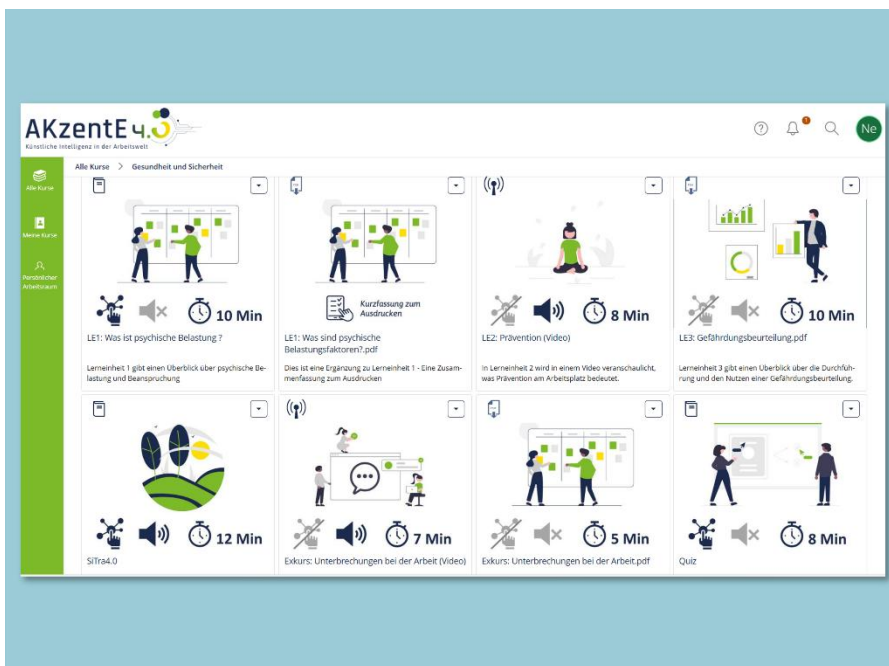
Einblick in die E-Learning Plattform