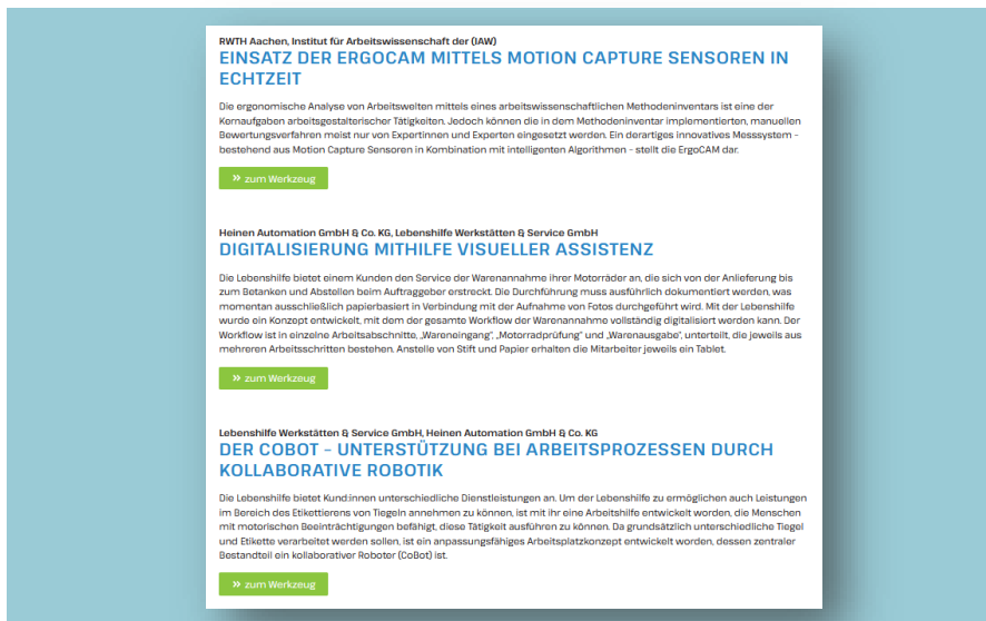
Ausschnitt aus der GALA-Toolbox zur Arbeitsgestaltung

Die GALA-Toolbox zur Arbeitsgestaltung kann Betriebsräte dabei unterstützen, ihre Mitbestimmungsrechte nach dem Betriebsverfassungsgesetz (BetrVG) wahrzunehmen und eine gesunde, innovative und menschengerechte Arbeitsgestaltung aktiv mitzugestalten. Sie bietet Werkzeuge, mit denen Betriebsräte Arbeitsprozesse analysieren, Belastungen erkennen und Verbesserungsmaßnahmen initiieren können. Damit leistet sie einen Beitrag zur Umsetzung der Aufgaben gemäß § 80 Abs. 1 BetrVG – insbesondere zur Überwachung der Einhaltung von