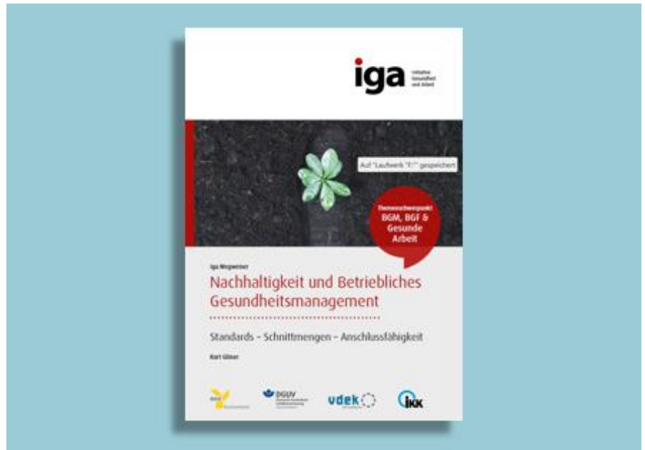
Titelseite des iga.Wegweisers „Nachhaltigkeit und Betriebliches Gesundheitsmanagement“

Der iga.Wegweiser „Nachhaltigkeit und Betriebliches Gesundheitsmanagement“ zeigt Schnittstellen zwischen den Themen Nachhaltigkeit und Betrieblichem Gesundheitsmanagement (BGM) auf und kann so zur betriebsinternen Erarbeitung und Umsetzung sozialer und ökologischer Ziele beitragen. Er gibt Betriebsräten Informationen, um eine förderliche Unternehmens- und Gesundheitskultur im Betrieb zu gestalten.