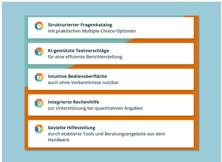
Ausschnitt von der Webseite des Zukunfts-Kompass Handwerk

Der Zukunfts-Kompass Handwerk gibt Hilfestellungen für bestimmte Maßnahmen, diese sollten – im Hinblick auf die Umsetzung – mit dem Betriebsrat besprochen werden. Ergeben sich daraus betriebliche Maßnahmen, die Auswirkungen auf die Arbeitsräume, die technischen Anlagen, die Arbeitsverfahren oder den Arbeitsplatz haben, ist der Arbeitgeber nach Betriebsverfassungsgesetz (BetrVG) verpflichtet den Betriebsrat rechtzeitig und umfassend zu informieren (§ 90 BetrVG). Darüber hinaus hat der Betriebsrat bei der Einführung technischer Einrichtungen, durch die das Verhalten oder die Leistung der Beschäftigten über-