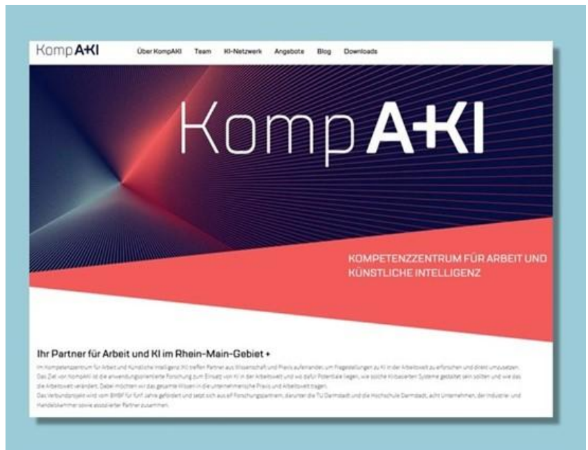
Website des Kompetenzzentrums @ IAD – TU Darmstadt

Im Kompetenzzentrum für Arbeit und Künstliche Intelligenz (KompAKI) in Darmstadt finden Betriebsräte in der Rhein-Main-Region Informationen der Wissenschaft zur Nutzung von KI im Betrieb wie Workshops, Fachgespräche Tools oder Lernfabriken. Das Angebot von KompAKI richtet sich zum Zeitpunkt der Erstellung dieses Praxisimpulses zwar nicht dezidiert an Betriebsräte, sie können hier aber dennoch interessante regionale oder inhaltliche Angebote finden.