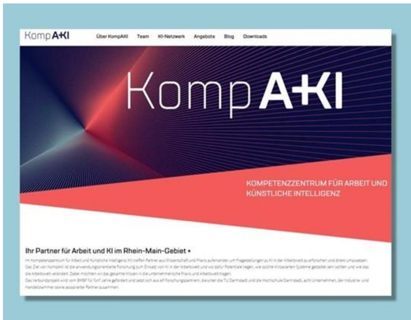
Website des Kompetenzzentrums @ IAD – TU Darmstadt

Im Kompetenzzentrum für Arbeit und Künstliche Intelligenz (KompAKI) in Darmstadt finden Betriebsräte in der Rhein-Main-Region Informationen der Wissenschaft zur Nutzung von KI im Betrieb wie Workshops, Fachgespräche Tools oder Lernfabriken. Das Angebot von KompAKI richtet sich zum Zeitpunkt der Erstellung dieses Praxisimpulses zwar nicht dezidiert an Betriebsräte, sie können hier aber dennoch interessante regionale oder inhaltliche Angebote finden.