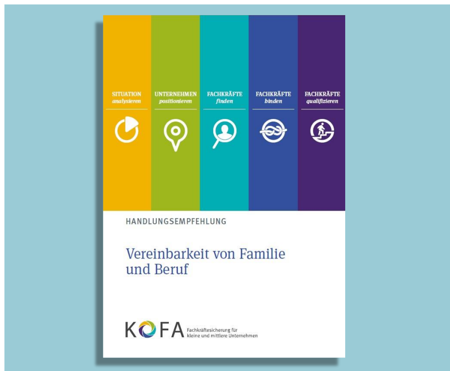
Titelbild der Handlungsempfehlung „Vereinbarkeit von Familie und Beruf“

Betriebsräte erfahren, wie diese Schritte konkret umgesetzt werden können und gelangen über Verlinkungen auf weiterführende Handlungsempfehlungen, Informationen