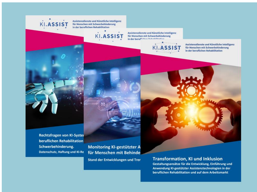
Abbildung: KI-ASSIST-Praxisbroschüren zu Nutzung von KI-Assistenzsystemen in der beruflichen Rehabilitation

In den KI-ASSIST-Praxisbroschüren finden Betriebsräte im Bereich der beruflichen Rehabilitation und in allen Betrieben zum Betrieblichen Eingliederungsmanagement (BEM) Informationen und Hilfen zum Einsatz von KI-gestützten Assistenzsystemen in der beruflichen Rehabilitation.