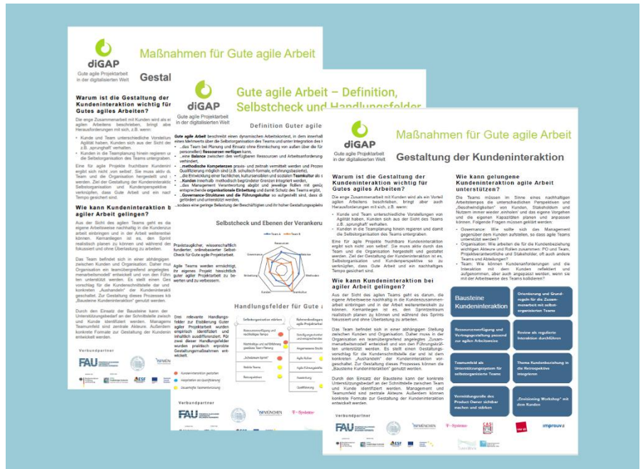
Abbildung: Kurze (eine Seite) Informationen zu Maßnahmen zum Selbstcheck „Gute agile Projektarbeit“

Betriebsräte können den Selbstcheck „Gute agile Projektarbeit“ sowie die