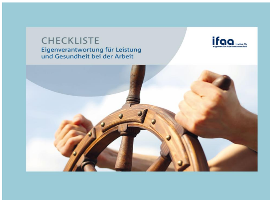
Abbildung: Titelblatt „Checkliste Eigenverantwortung für Leistung und Gesundheit bei der Arbeit“