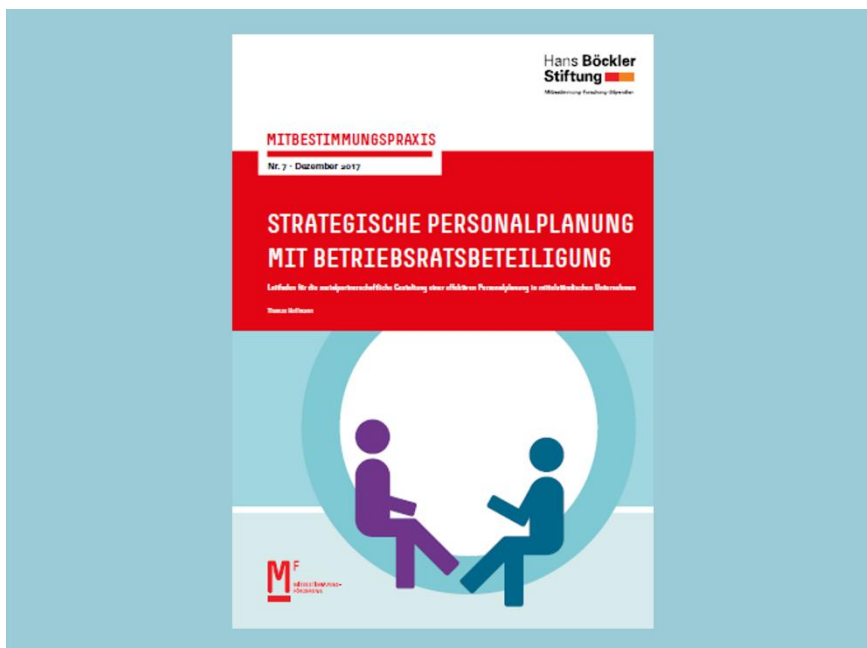
Abbildung: Titelblatt Leitfaden „Strategische Personalplanung mit Betriebsratsbeteiligung“

Eine geeignete Systematik liefert der Leitfaden „Strategische Personalplanung mit Betriebsratsbeteiligung“ . Im Rahmen eines Workshops setzen Betriebsrat, Personalabteilung und Führungskräfte gemeinsam sinnvolle Schwerpunkte in der Personalarbeit und planen vorausschauende personalwirtschaftliche Maßnahmen.