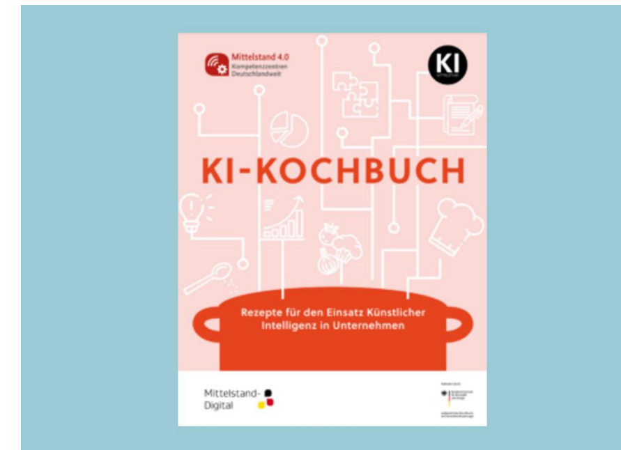
Abbildung: Praxisbroschüre „KI-Kochbuch - Rezepte für den Einsatz Künstlicher Intelligenz in Unternehmen“