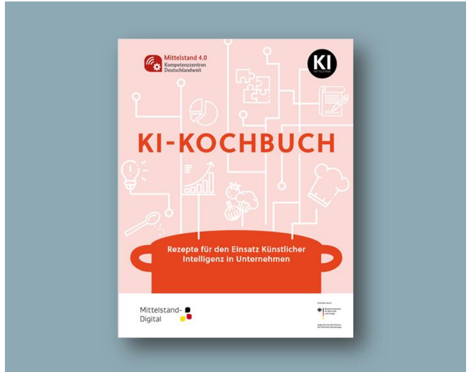
Abbildung: Praxisbroschüre „KI-Kochbuch - Rezepte für den Einsatz Künstlicher Intelligenz in Unternehmen“