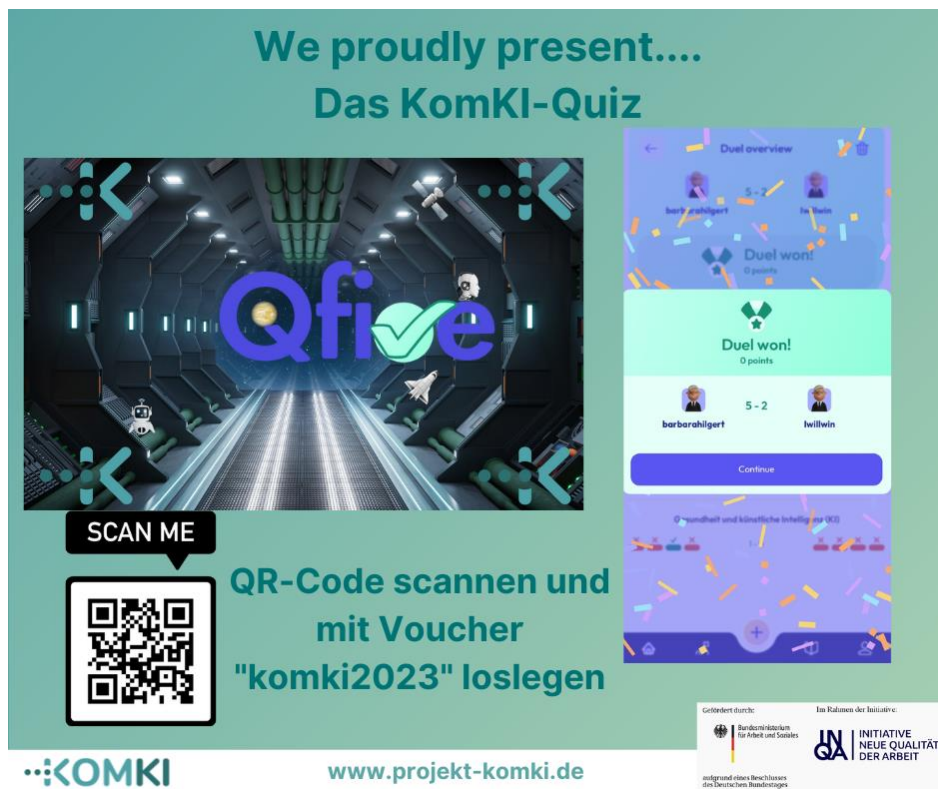
Abbildung: Impressionen des KomKI-Quiz

Über einen kurzen Infotext ist zu erkennen, warum die Frage richtig oder falsch beantwortet wurde. Darüber hinaus erhält man weiterführende Informationen zu KI und den Link zum KomKI-Baukasten .