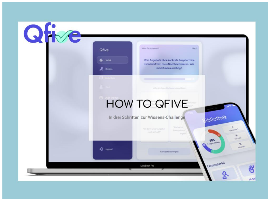
Abbildung: Das KomKI-Quiz in QFive

Unternehmensbereichen hat (u. a. zu Beteiligungsmöglichkeiten, Mitbestimmung bei der Leistungs- und Verhaltenskontrolle, Handlungsspielräumen, Datenschutz). Hierbei kann die App dazu dienen, sich selbst in kurzer Zeit weiterzubilden. Betriebsräte können sie zudem Führungskräften als Werkzeug an die Hand geben, damit diese einen Einblick in das Thema partizipative und menschengerechte Einführung und Nutzung von KI erhalten. Zudem kann gemeinschaftlich die KI-Wissensbasis mit einem hohen Spaß-Faktor erweitert werden.