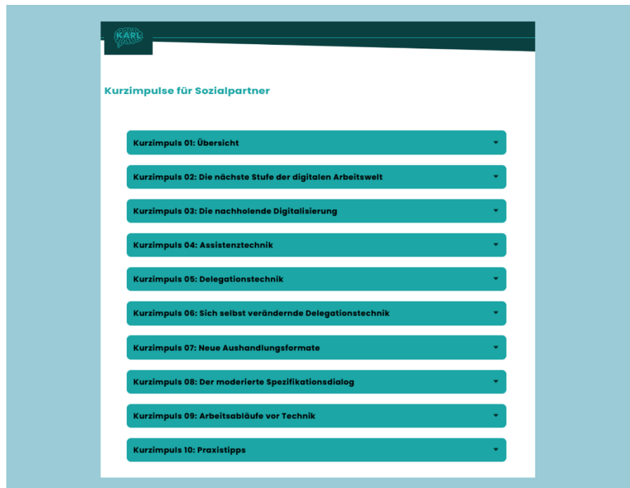
Überblick über die Kurzvideos für Sozialpartner des Kompetenzzentrums KARL