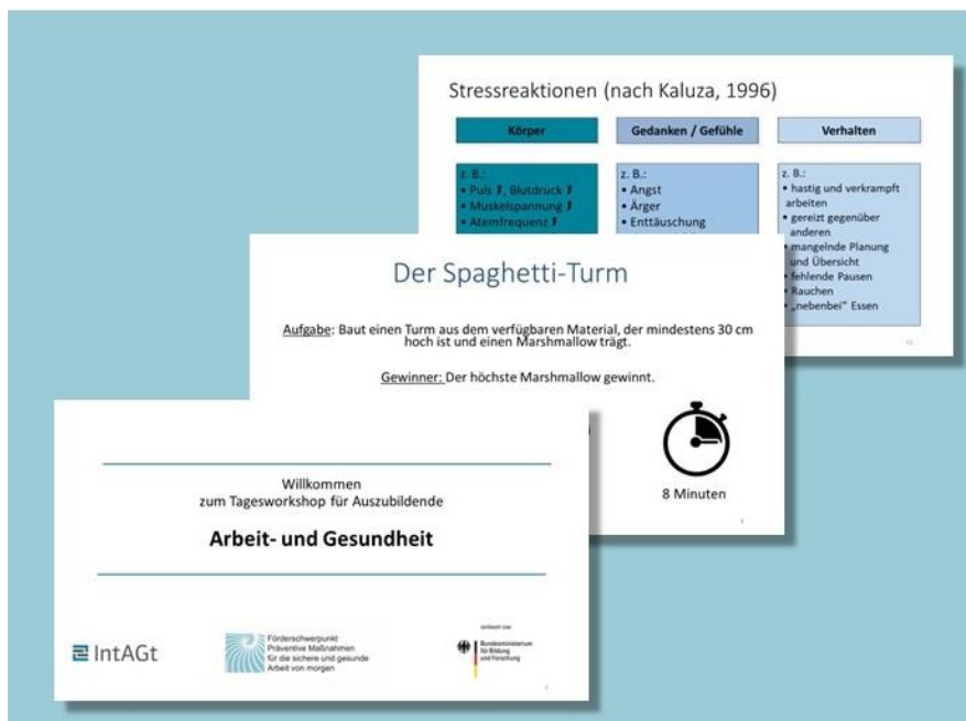
IntAGt-Musterfoliensatz - Beispielseiten

Mit den IntAGt-Lern- und Lehrhilfen können Beratende somit dazu beitragen, dass die Auszubildenden und auch die Beschäftigten im Kundenbetrieb ein Sicherheits- und Gesundheitsbewusstsein entwickeln, das zu produktiven, motivierten und gesundheitsgerechten Arbeiten beiträgt. Die IntAGt-Lern- und Lehrhilfen können direkt im Kundenbetrieb von qualifizierten Personen eingesetzt werden. Die Workshops können auch vom Beratenden selbst moderiert werden. Aufwendige Vorbereitungszeiten entfallen.