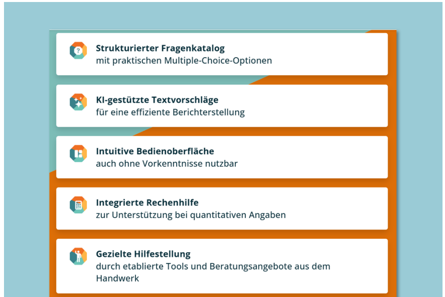
Ausschnitt von der Webseite des Zukunfts-Kompass Handwerk

Der Zukunfts-Kompass Handwerk hilft Beratenden dabei, Handwerksbetriebe strukturiert zu Nachhaltigkeitsthemen und zur effizienten Berichterstattung auf Basis des VSME-