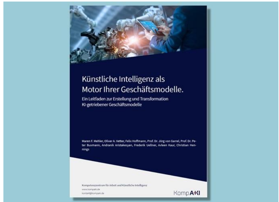
Titel des KompAKI-Leitfadens zu KI-Geschäftsmodellen (PDF-Download)

In dem 32-seitigen Leitfaden werden folgende Inhalte vermittelt: Es erfolgt ein Einstieg zu Hintergrund-