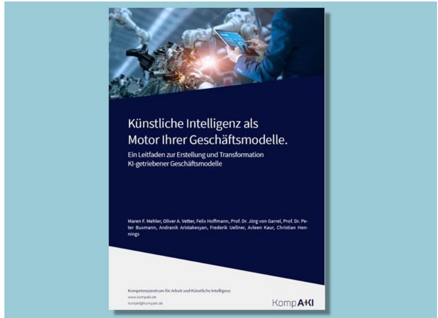
Titel des KompAKI-Leitfadens zu KI-Geschäftsmodellen (PDF-Download)

In dem 32-seitigen Leitfaden werden folgende Inhalte vermittelt: Es erfolgt ein Einstieg zu Hintergrund-