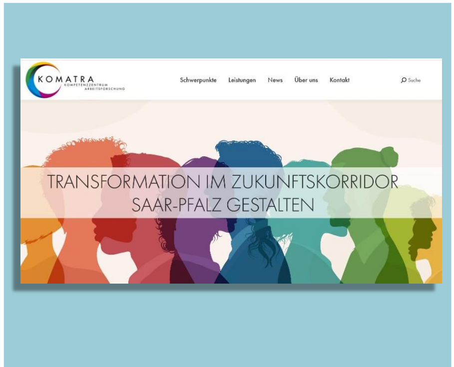
Einblicke in die Homepage des Kompetenzzentrums KOMATRA

KOMATRA Pilotprojekte: KOMATRA führt in Betrieben der Automobilbranche und Medizintechnik Pilotprojekte zum wertorientierten