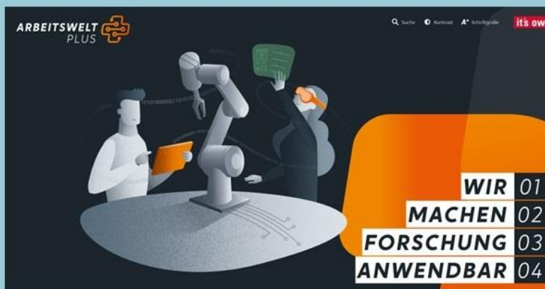
Website des Kompetenzzentrums mit allen Angeboten

Das Kompetenzzentrum Arbeitswelt.Plus bietet Beratern und Beraterinnen konkrete Lösungen und Hilfen für die Beratung, um KI und deren Auswirkungen im Kundenbetrieb