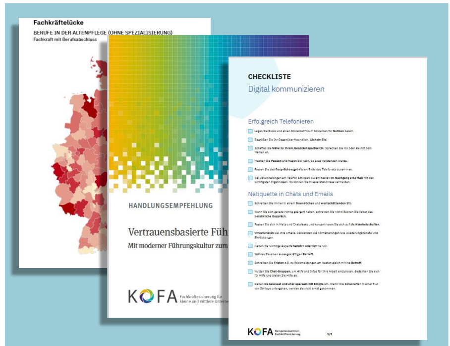
Einblicke in die Produkte des Kompetenzzentrum Fachkräftesicherung (KOFA)

Beratende finden im Kompetenzzentrum zu allen Themen der Fachkräftesicherung und Personalarbeit Unterstützung für ihre Beratung. Dabei können die Angebote sowohl zum niederschweligen Einstieg in die Thematik wie auch als wissenschaftliche Informationsquelle oder als Grundlage für die (Weiter)Entwicklung des Beratungsangebots dienen.