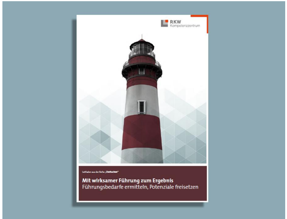
Abbildung: Titelblatt „Mit wirksamer Führung zum Ergebnis“

2. „ERFOLG ermöglichen“ durch die Schaffung guter Voraussetzungen für die Leistungserbringung