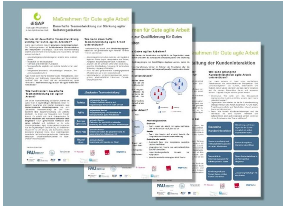
Abbildung: Kurze (eine Seite) Informationen zu Maßnahmen zum Selbstcheck „Gute agile Projektarbeit“