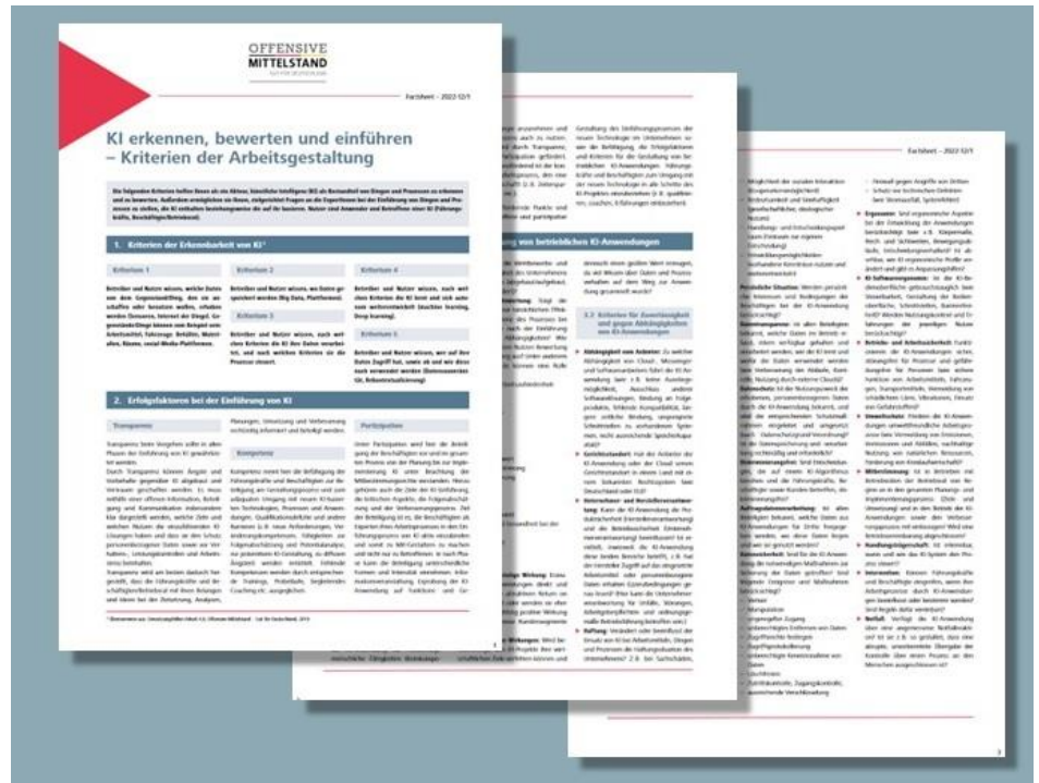
Abbildung: Das Factsheet „KI erkennen, bewerten und einführen – Kriterien der Arbeitsgestaltung“

Das Factsheet KI-Kriterien zur Arbeitsgestaltung ist als PDF-Download erhältlich.