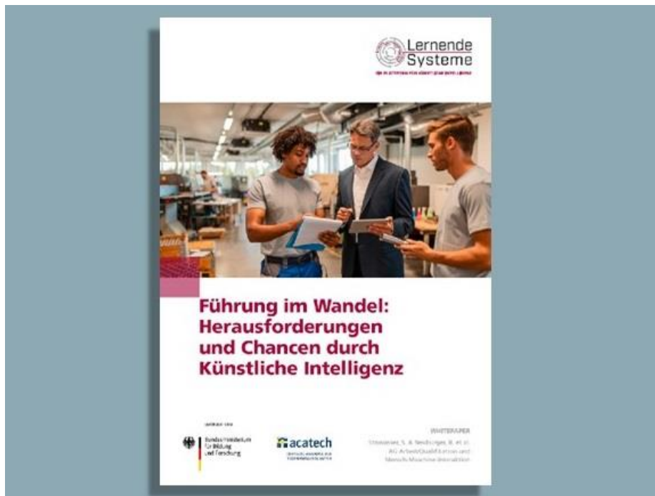
Abbildung: Titelblatt des Whitepaper „Führung im Wandel: Herausforderungen und Chancen durch Künstliche Intelligenz“

Welche Maßnahmen dabei helfen, KI-Systeme für Führungsaufgaben einzusetzen beschreibt der Leitfaden anhand passender Gestaltungsempfehlungen. Dazu gehören unter anderem: