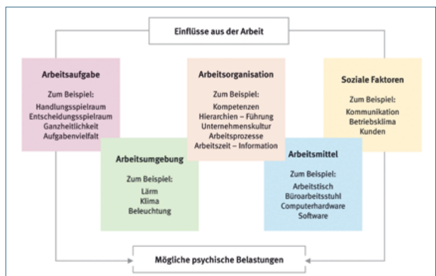
Abbildung 1: Einflüsse der Arbeit auf den Menschen und mögliche psychische Belastungen (aus BGI 650 „Bildschirm- und Büroarbeitsplätze“, S. 13).

Ein und dieselbe Belastung kann bei verschiedenen Personen zu unterschiedlichen Beanspruchungen führen. Im Falle negativer Auswirkungen werden Belastungen meist als Stressoren und Beanspruchungen als Stress(-reaktionen) bezeichnet. Ob aus einer Belastung beeinträchtigende oder anregende Effekte resultieren, hängt von den Ressourcen